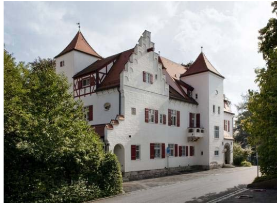
Villa Eberhard Heidenheimer Str. 80, Ulm